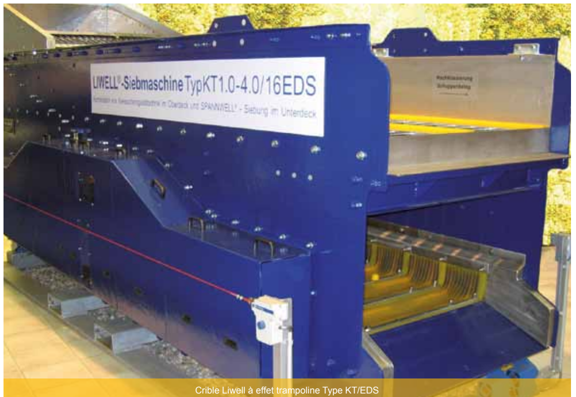
Crible Liwell à effet trampoline Type KT/EDS

Certaines applications demandent du „doigté“