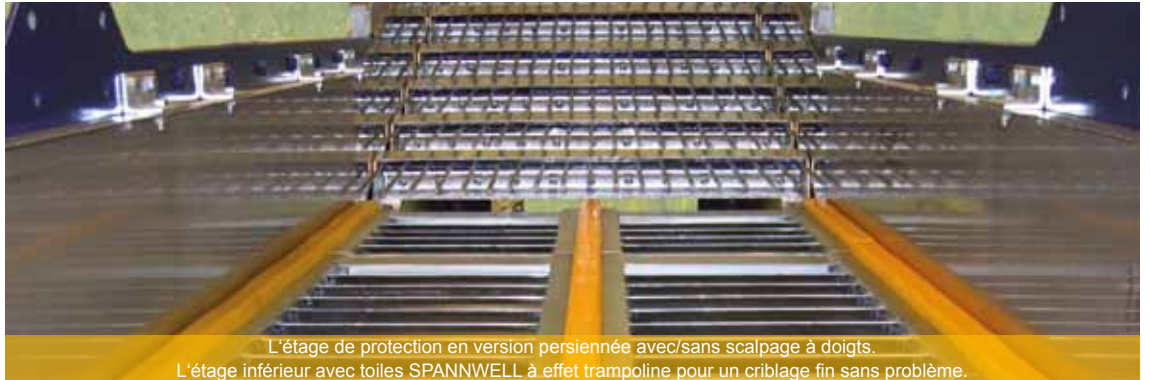
L'étage de protection en version persiennée avec/sans scalpage à doigts. L'étage inférieur avec toiles SPANNWELL à effet trampoline pour un criblage fin sans problème.